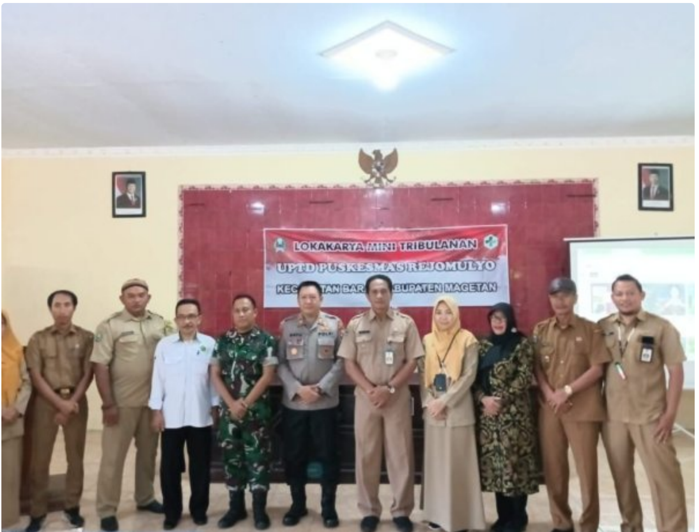
Danramil 0804/08 Barat Hadiri Lokakarya Mini Tribulan IV UPTD Puskesmas Rejomulyo