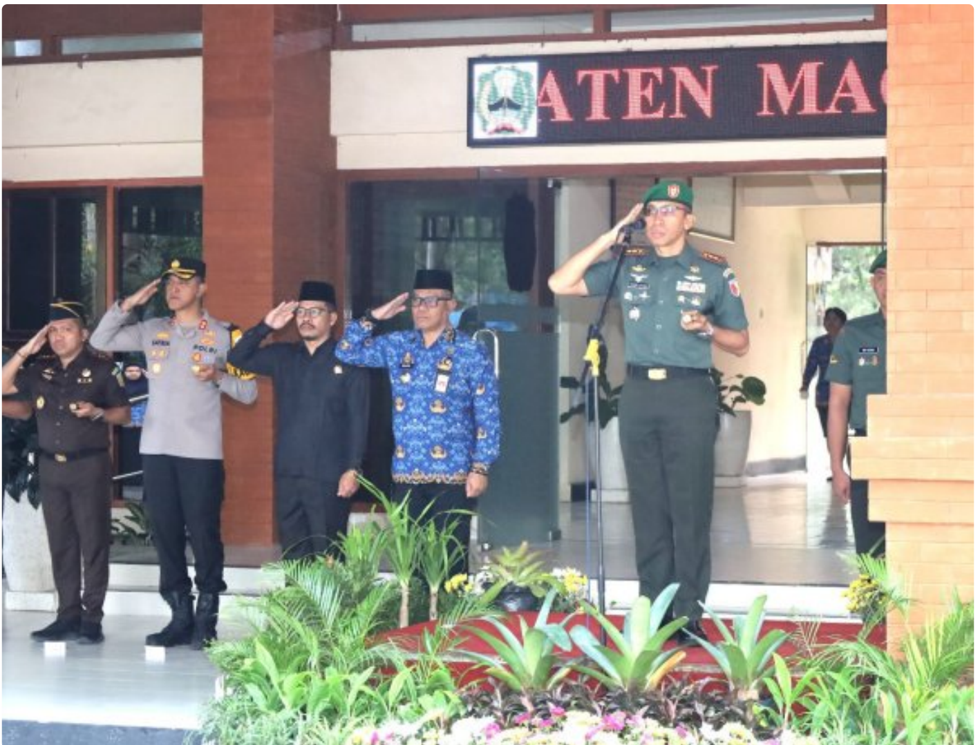
Dandim 0804/Magetan Pimpin Upacara Peringatan Bela Negara Ke-76 Tahun 2024